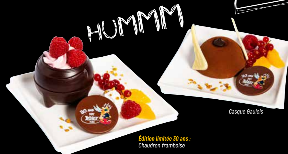
Édition limitée 30 ans : Chaudron framboise