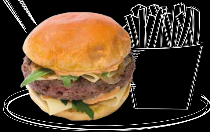
Le burger de sanglier