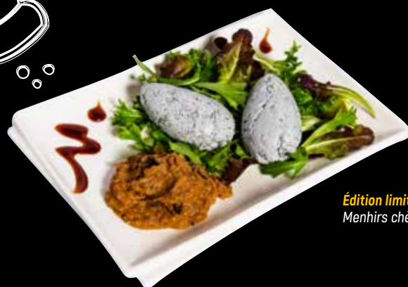
Édition limitée 30 ans : Menhirs chèvre miel