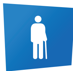
PERSONNE À MOBILITÉ RÉDUITE

Pour une assistance médicale ou spécifique, adressez-vous au poste de premier secours dans le Parc.